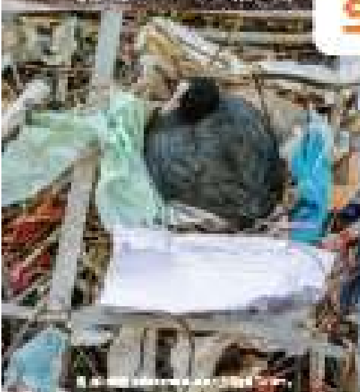
鳥の営巣材にプラスチックが混入している