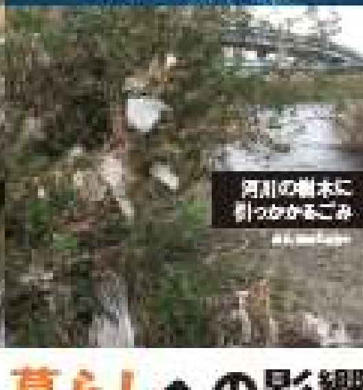
河川の樹木に引っかかるごみ