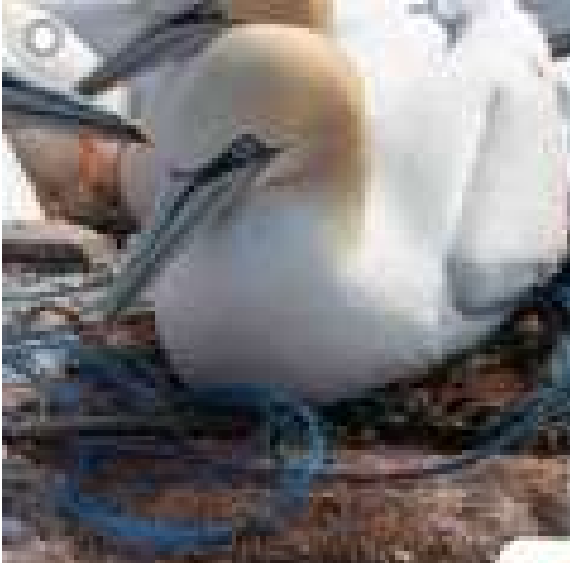
鳥の営巣材にプラスチックが混入している