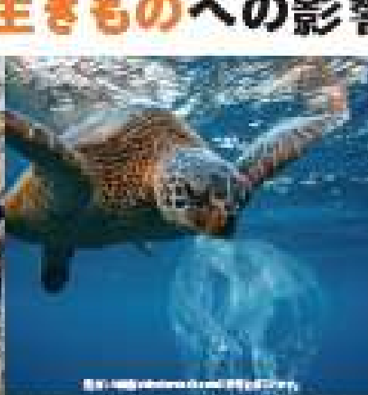
鳥の営巣材にプラスチックが混入している