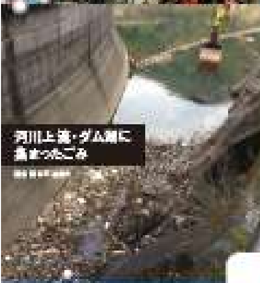
河川と海・ダム湖に集まったごみ