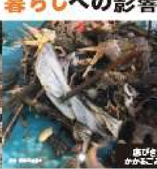
鳥の営巣材にプラスチックが混入している