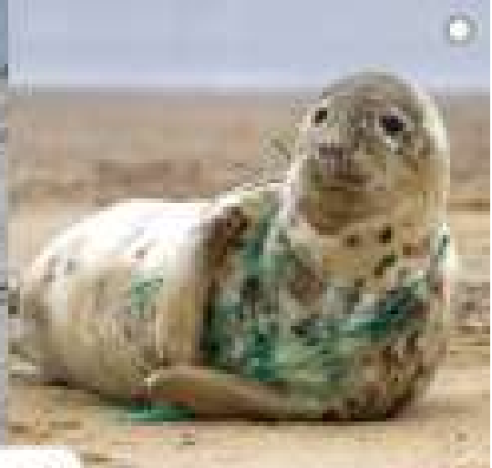
鳥の営巣材にプラスチックが混入している