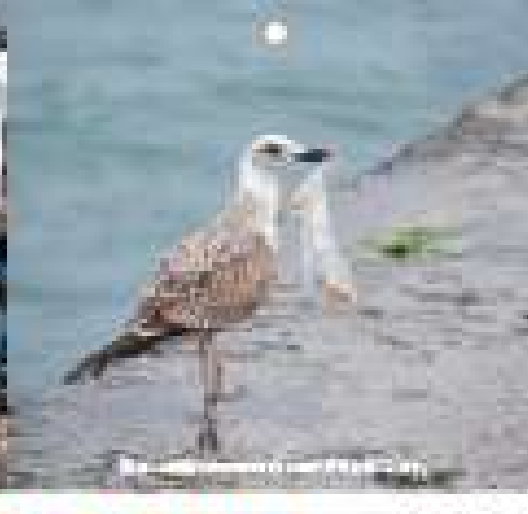
鳥の営巣材にプラスチックが混入している