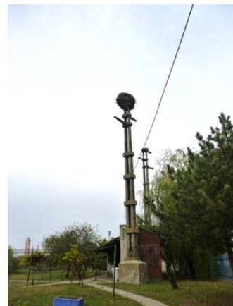
コウノトリの巣塔