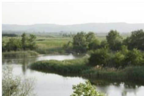
ポニャビツァ自然公園