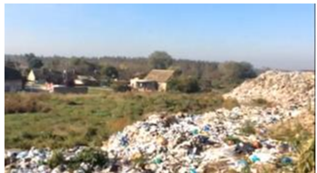
古い廃棄物処分場