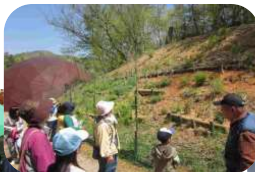
自然観察会の開催