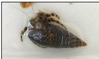
ユビナガホンヤドカリ