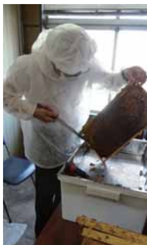
▲ハチミツ採取作業中の理事長

ミツバチは勤勉であり世話をやくこともなく、巣箱近くに水を置くのと時々中を覗いてやる程度です。女王蜂は元気が、の確認が主な目的です。日常の世話は組合職員がやりますが、採取時には組合員企業の有志にも手伝って頂きます。これも縁なのでしようか、指導者の助手が県職員のOBで、とても丁寧に巡回し懇切に指導してくれま