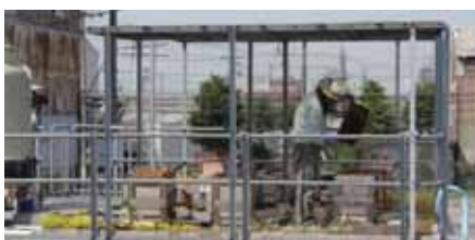
▲工場団地の養蜂場全景

今後も、ミツバチが緑をもたらし、21世紀全体を時間軸にした森づくりにした森づくりという尼崎の夢へと我々を運んでくれるよう願っています。