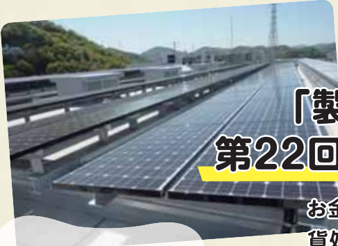
2012年5月に完成した本社社屋には太陽光発電パネルも設置

お金を“数える・見分ける・束ねる”。正確性とスピードを実現する世界的な通貨処理技術を基盤に、安心・確実な社会の発展への貢献を目指すグローリー株式会社。環境的側面でも着実な取り組みが推進されています。