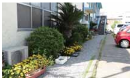
▲彩り豊かな組合共同スペース

で応募しました。約1400㎡の駐車場を緑化ブロックや保護材で芝を保護しながら、全面芝生にしようという計画です。平成20年に補助対象に選ばれ芝生化を開始し昨年10月に完成すると、駐車場の緑で安らぎを感じるとの声も耳にします。