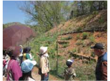
▲春の里山探検隊(特別プログラム)

問い合わせ先 / ひょうご環境体験館 〒679-5148 兵庫県佐用郡佐用町1-330-3 Tel.0791-58-2065 Fax.0791-58-2069 http://www.eco-hyogo.jp/taikenkan/ 開館時間: 午前10時~午後5時 休館日: 月曜日(祝日の場合は翌火曜日)、12月31日、1月1日