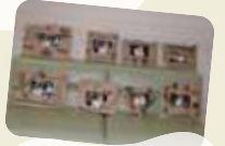
森の素材を利用したフォトフレーム