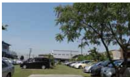
▲緑が増えた組合駐車場