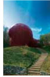
▲ひょうご環境体験館

展示やビデオを「見る」、自然を利用しておもちゃを「作る」、風・音・光を使って遊ぶおもちゃを通して自然に「ふれる」など、「見る、作る、ふれる」といった体験を通して楽しく環境学習してみませんか?