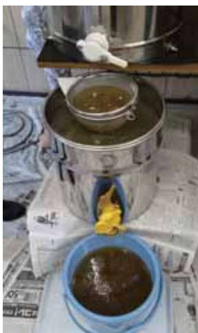
▲精製中のハチミツ

また、海辺の養蜂は、実は意外な好条件に恵まれています。ミツバチの天敵スズメバチの巣から遠いことです。開始後2回ほど偵察隊が来ましたが、本格的な襲撃はありません。何事もやってみないとわからないものです。