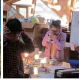
▲おももしろ環境科学実験