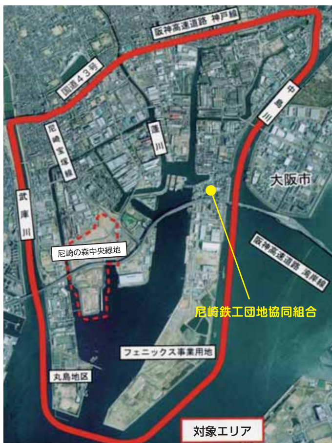
▲「尼崎21世紀の森構想」対象エリア

素材型産業等にぎわった尼崎臨海地域は、産業構造の変化により遊休地が出てくるなど、その再生が課題になっています。この地域の活性化を