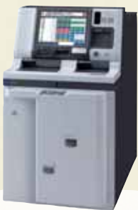
2012年度は17機種のG-ECO製品*3が開発されました。写真は新機能追加により両替管理業務の負担を大幅に軽減しつつ、使用時のCO 2 排出量を従来機種比30%低減した多能式紙幣両替機(EN-700)。

*1 デマンドコントロール：電気料金のうち、基本料金は使用する瞬間最大電力(デマンド値)で決められるため、その最大電力を制御することにより、電気料金を節約すること。 *2 グローリー夢咲きの森：2011年3月に同社と兵庫県、兵庫県緑化推進協会、姫路市で「企業の森づくり活動」の取組に関する協定を締結し、營生潤生産森林組合から借用した森林で、地元、行政、森林組合そして社員の連携協力で、生物多様性保全に向けた森林整備活動が進められている。 *3 G-ECO製品：同社では、環境に配慮した製品の開発と提供に当たり省エネだけでなく様々な社内環境基準を達成した製品を「G-ECO製品」と認定されています。