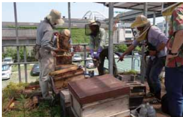
▲ハチミツ採取作業

平成22年4月、使わなくなった組合ボイラー室屋上で、西洋ミツバチの巣箱2箱(6万匹)からのスタートです。海辺での養蜂はあまり例がないとの事でしたが、経験豊富な指導者の適切な助言とサポートを得て、はちみつ採取は順調に推移しました。1年目は9回採取して232kg、2年目は箱を1つ増やし3箱体制で281kg(8回採取と量は増えました。3年目となった24年度は、6箱に増やし8回採取して391kgのはちみつを収穫しまし