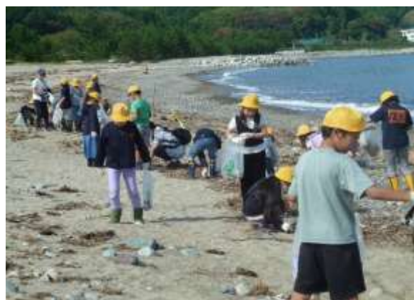
クリーン但馬10万人大作戦