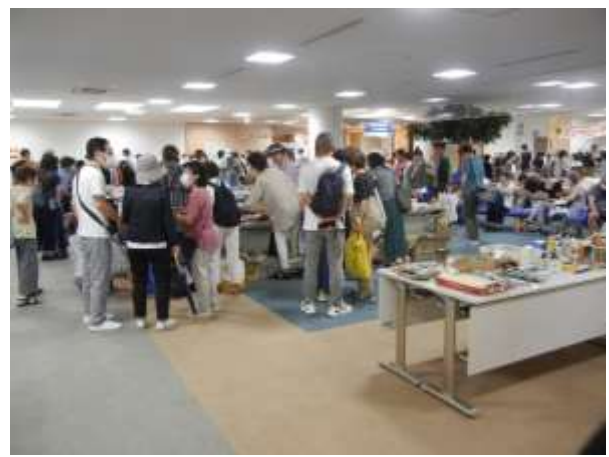
国崎クリーンセンター啓発施設「ゆめほたる」での啓発活動 (海ごみ企画展・掘り出しもの探しでユース活動！ファミリーフリーマーケットフリーマーケット)