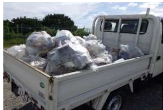
浄化センター外周及び隣接空地