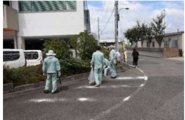
クリーンアップ活動