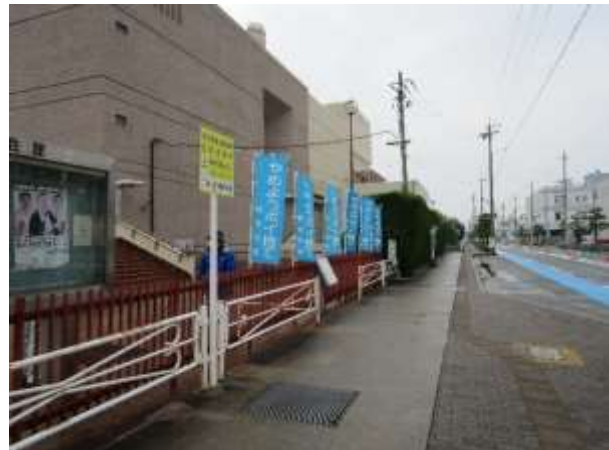
懸垂幕・横断幕・のぼり掲揚等による啓発活動