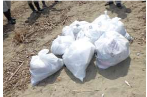
まちかど 100m クリーンアクション 浄化センター放流口周辺