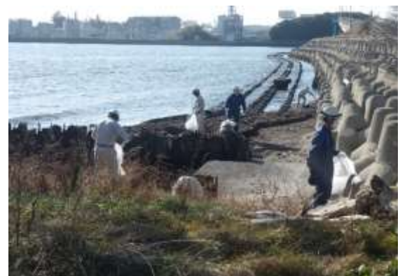
浄化センター外周及び放流口周辺