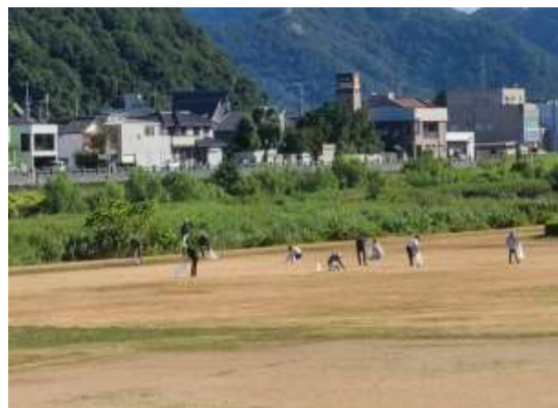
揖保川水系クリーン作戦