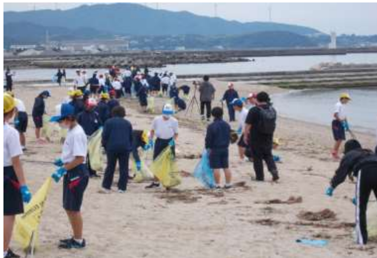
西淡中学校 ボランティア清掃