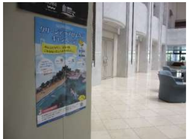
ポスター・チラシ掲示・啓発品の配布