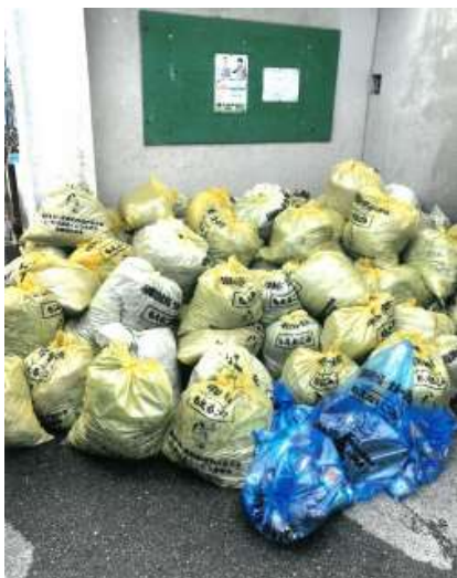
淡路全島一斉清掃（7月・11月）