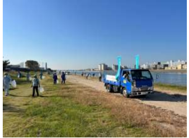
尼崎市内 武庫川河川敷左岸