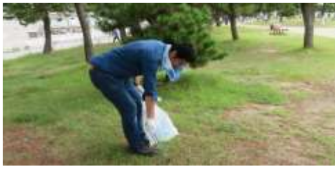
明石大蔵海岸清掃活動