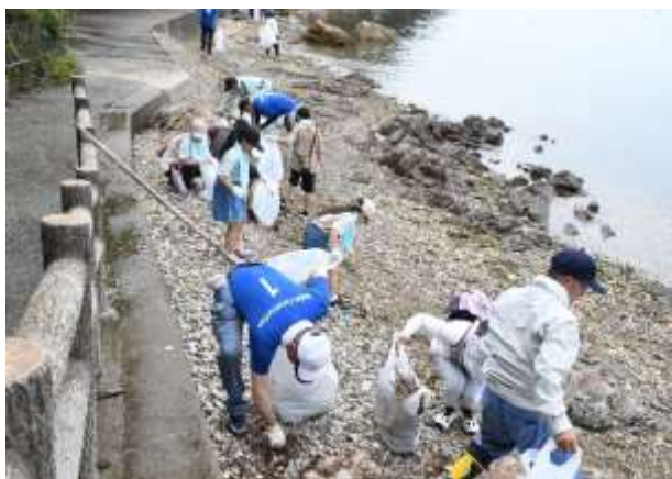
リフレッシュ瀬戸内での一斉清掃