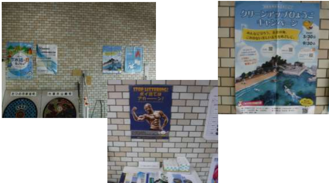
ポスター掲示・啓発資材設置