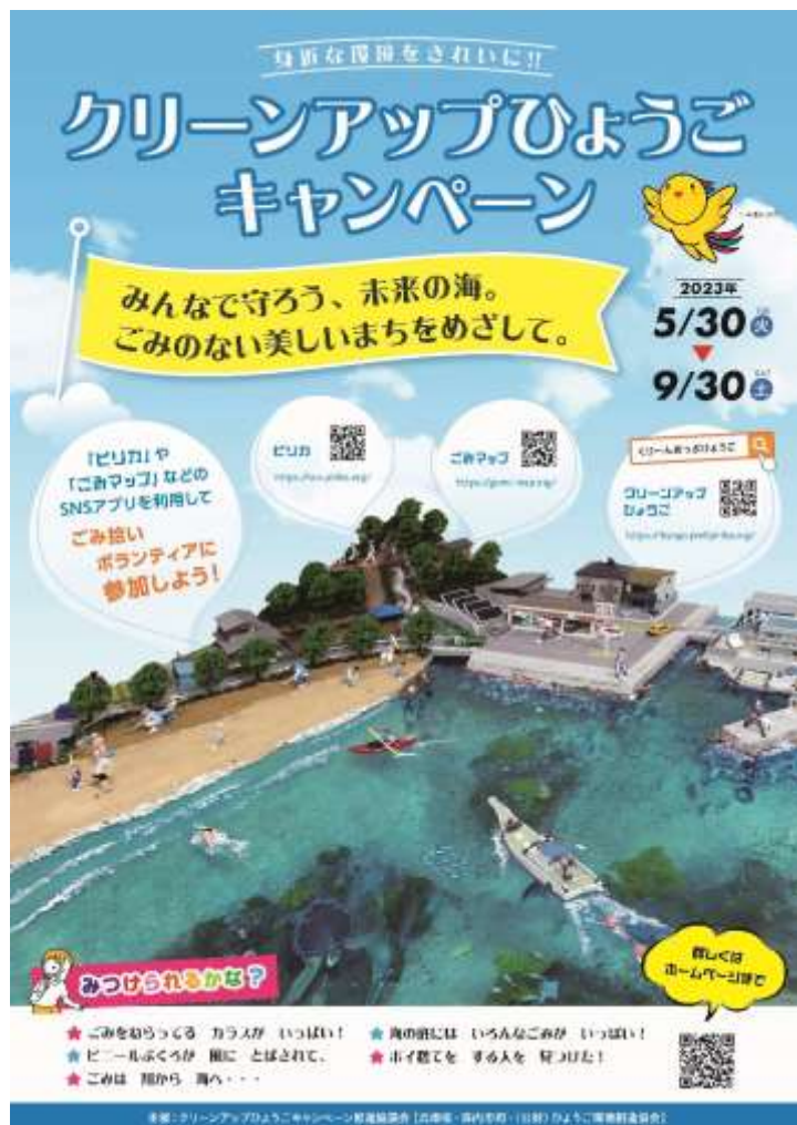
ポスターのデザイン

ポスター900枚を作成し、市町・県民局・協力団体等を通じて配布しました。合わせて、ごみ拾いSNSアプリ「Pirika」のチラシも配布しました。