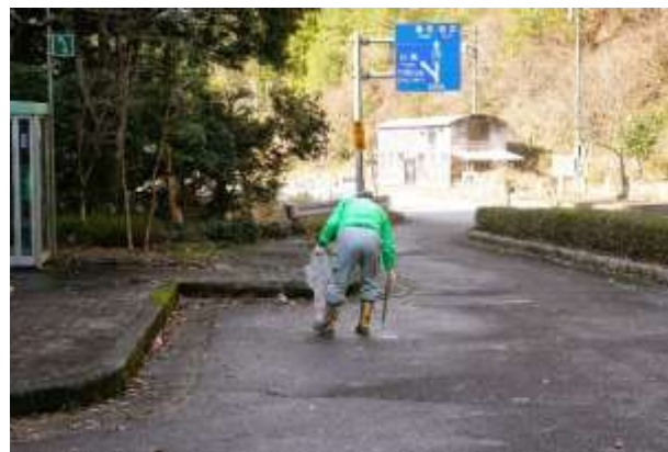
アクセス道路クリーン作戦