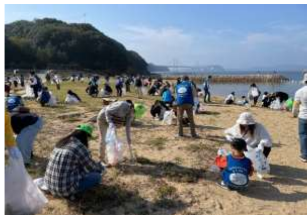
3海峡クリーンアップ大作戦