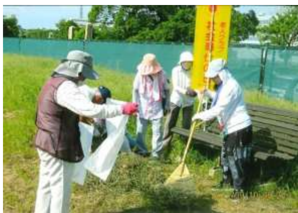
クリーンキャンペーン