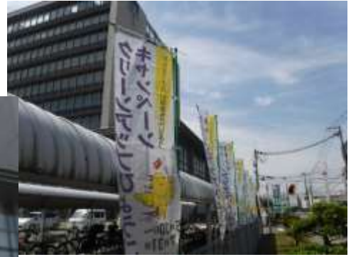
ポスター掲示・懸垂幕掲揚・幟旗設置