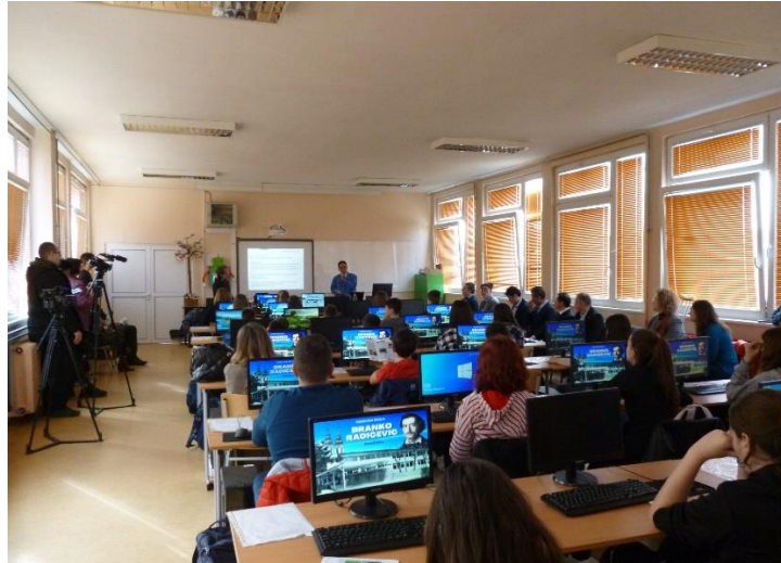
ブランコ・ラディツェビッチ小学校における授業、現地マスコミの取材あり