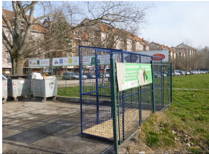
ドライ廃棄物（紙・プラスチック・金属）リサイクルのための 集積場（青色フェンス内）