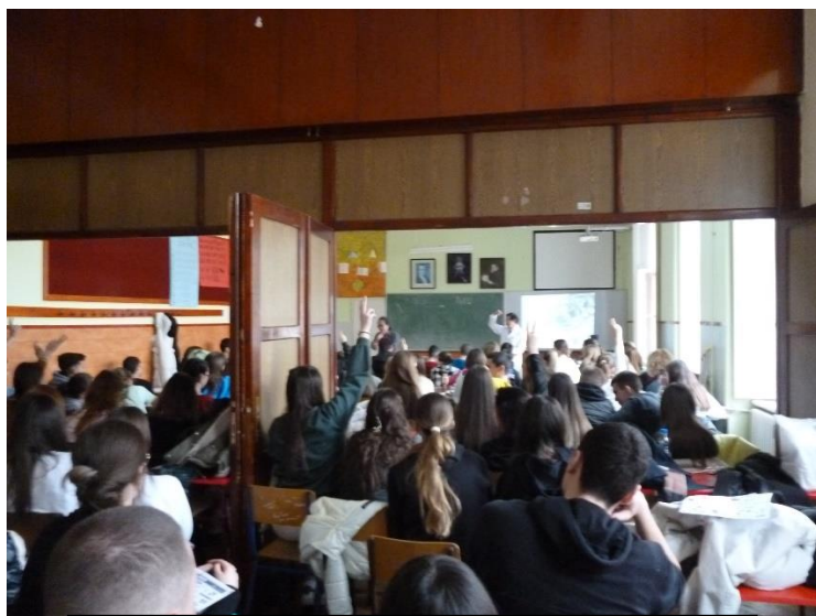
ミハイロ・プピンにおける講義