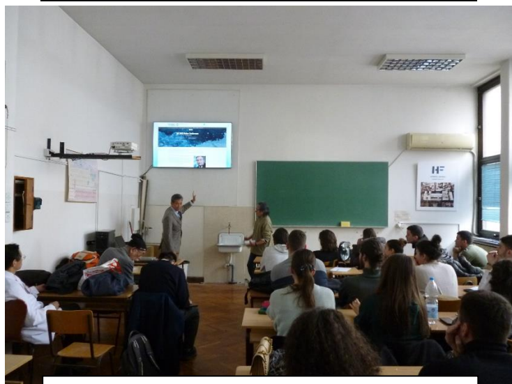
ベオグラード大学化学部における講義