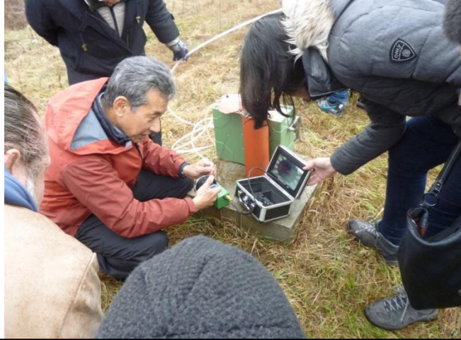
地下水汚染モニタリング用井戸の内部状況調査