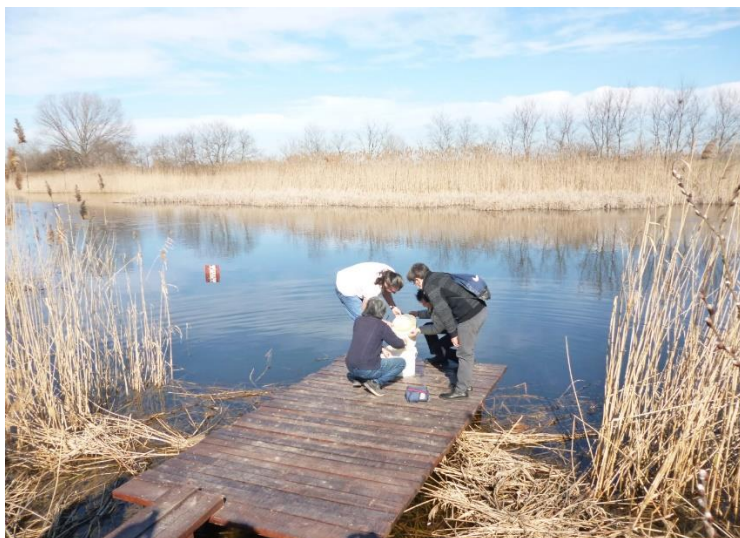
ポニャビツァ自然公園における採水（プランクトン調査）