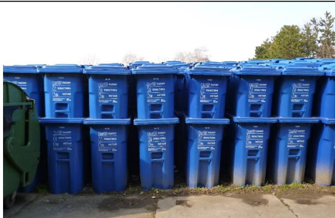
ドライ廃棄物（紙・プラスチック・金属）リサイクルのために 各家庭に配達されようとしている容器