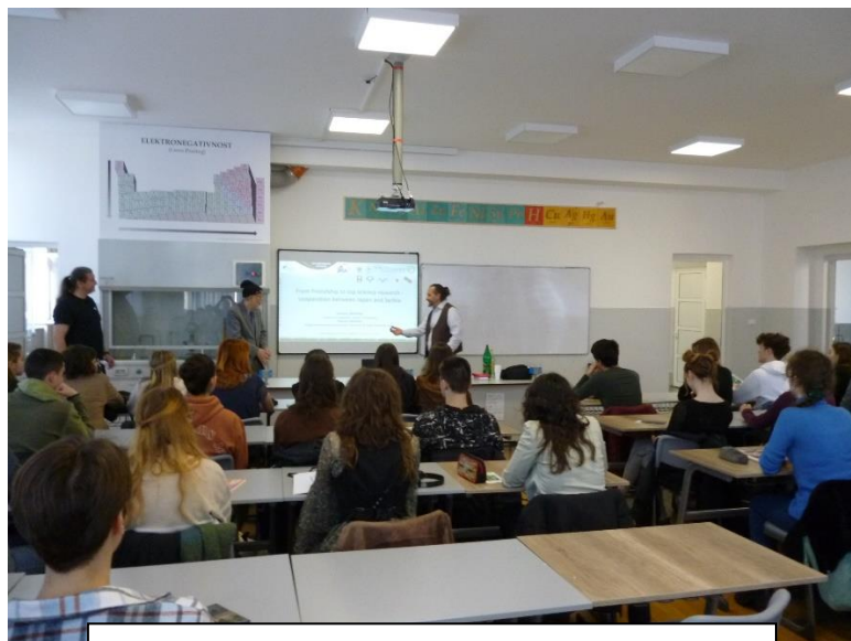
第5ベオグラード・ギムナジウムにおける講義