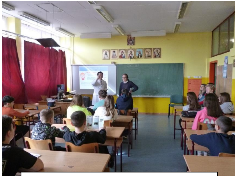
バナツキ・ブレストバツ小学校における授業